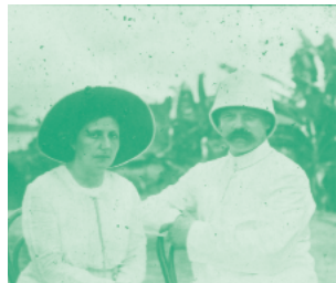
Albert Schweitzer mit Helene Schweitzer

Frankreich führt den Zehn-Stunden-Tag und die gesetzliche Altersversorgung der Arbeiter ein.