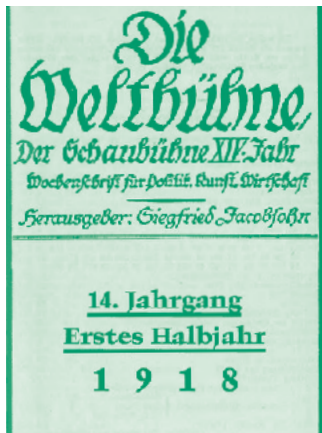
Siegfried Jacobsohn – «Die Schaubühne» (ab 1918 «Die Weltbühne»).